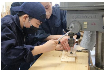
ボール盤による部材の穴開け