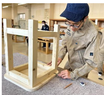
スツールの座面付け