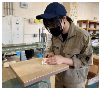
糸鋸による部材調整