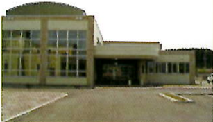
▲寄宿舍「明誠寮」外観