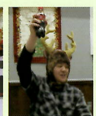
▲舎内行事(サマーイベント・ウィンターフェスティバル)