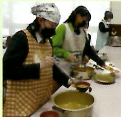
▲掃除・食事準備の様子