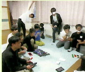
▲▼男子棟・女子棟の様子